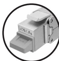
Rj45 Keystone Jack